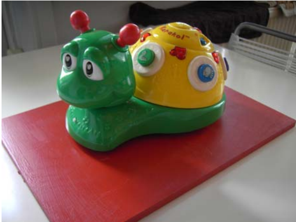
Een geluiden/liedjes slak