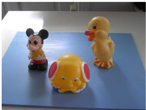
Enkele piepende diertjes