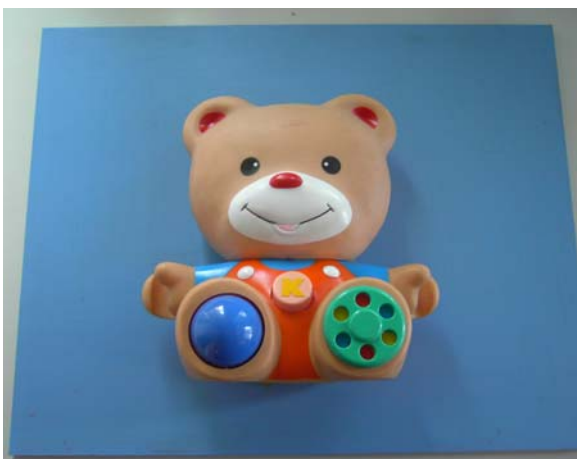
Een activiteiten beer