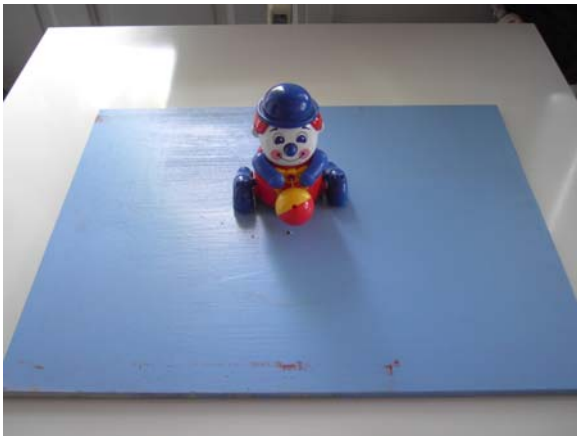
Een clown dat trappelt wanneer je aan de bal trekt